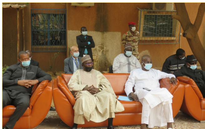
Les autorités présentes

Depuis l'apparition à Wuhan en Chine le 19 Décembre 2019 de la maladie à coronavirus dite COVID-19 et de sa déclaration comme pandémie, par l'OMS en Mars 2020, le CERMES, en tant que Laboratoire National de Référence, en charge du diagnostic de la grippe et des fièvres hémorragiques s'était naturellement activé à assurer le diagnostic de la maladie pour l'ensemble du pays.