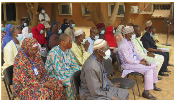
Photo des récipiendaires

Toutes ces actions requièrent un personnel voué à la cause, et l'activité qui nous réunit aujourd'hui rentre de le cadre de cette promotion, pour une culture de l'innovation, de l'amélioration des performances.