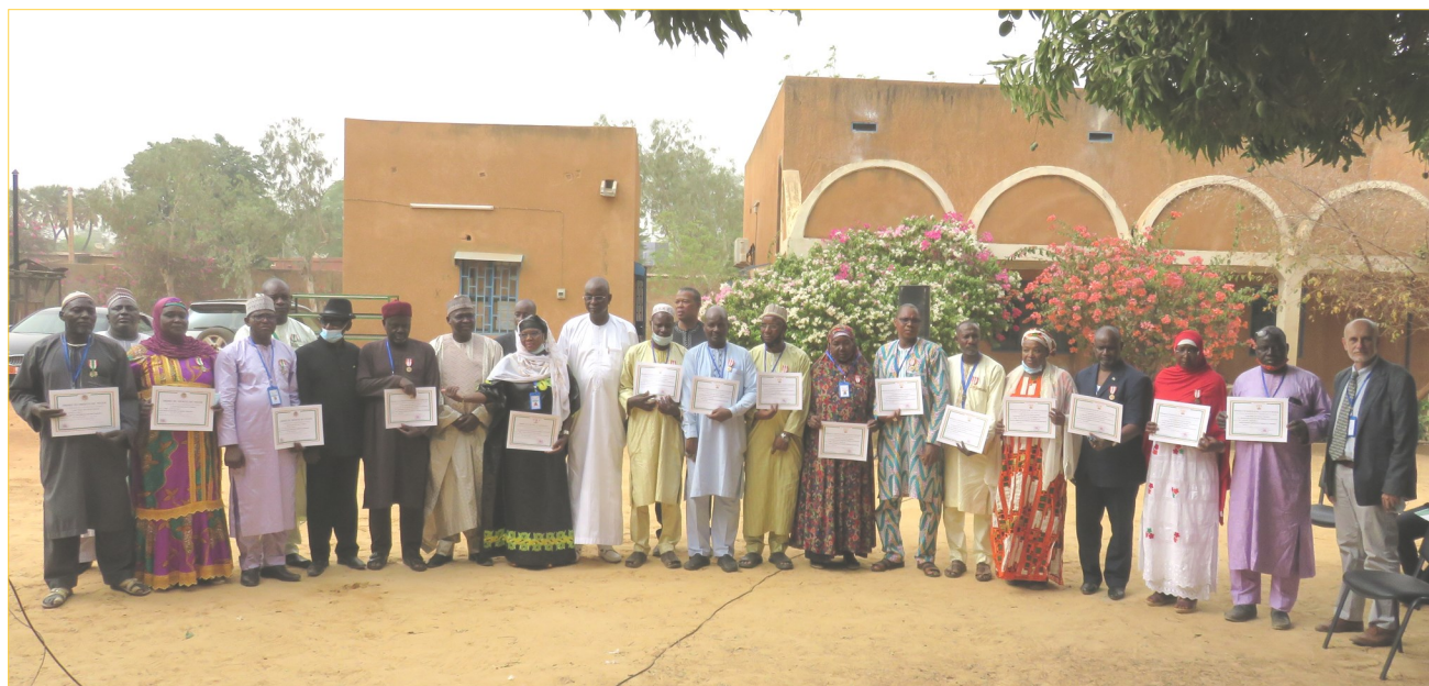
Photo de famille des récipiendaires avec les autorités présentes