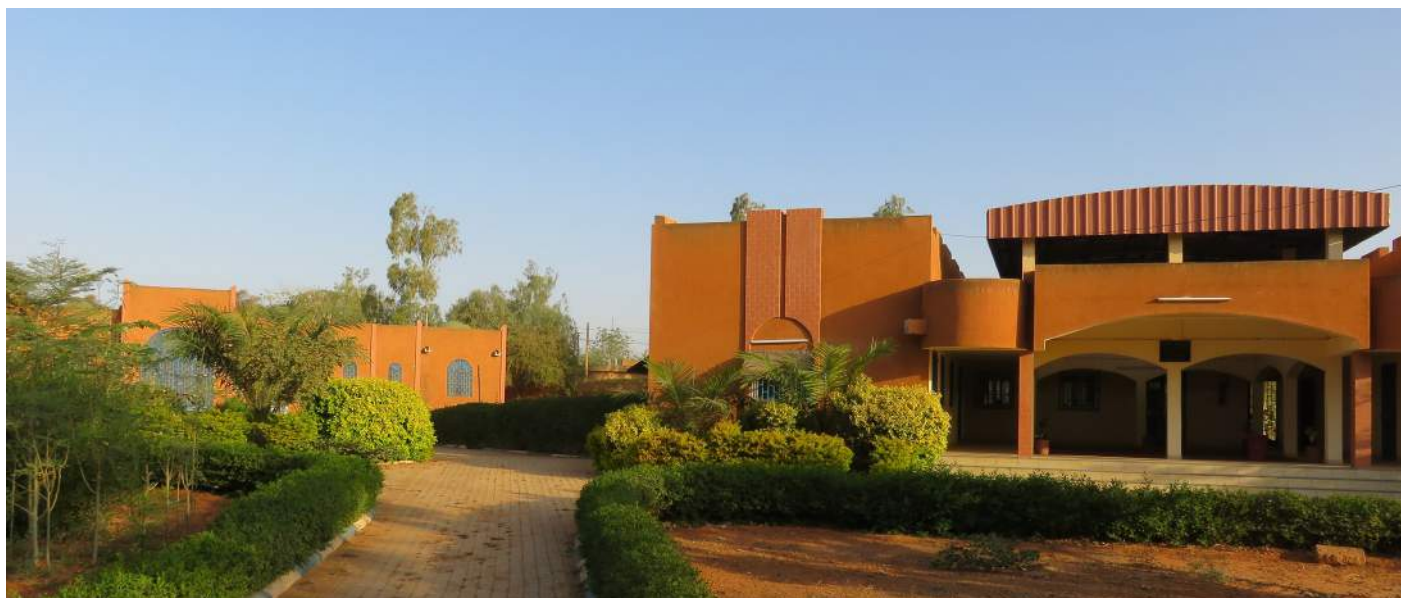
Centre de Formation et d'hébergement

Le Centre de Formation Pierre et Anne-Marie Moussa (CFPAM) a été inauguré le 15 février 2012 pour servir de cadre de formation aux professionnels et étudiants du domaine des sciences de la santé au Niger.