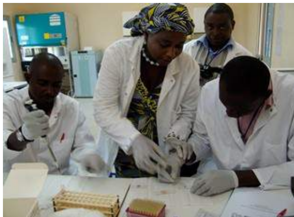
Séance de travaux pratiques