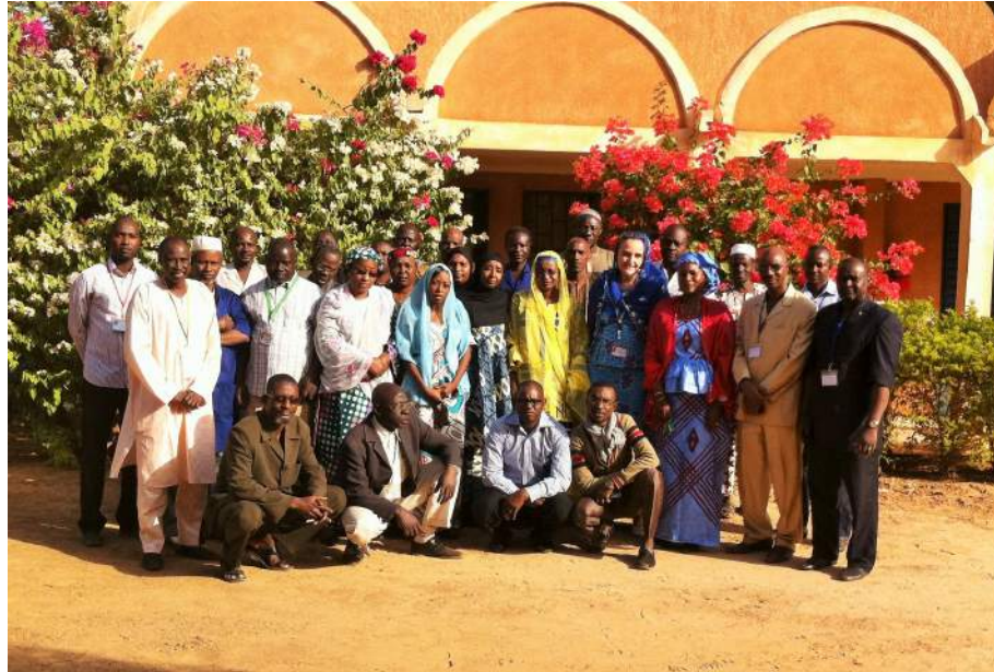
Photo de famille, Décembre 2014

Le CERMES avait été créé en 1980 par l'Organisation de Coopération et de Coordination pour la lutte Contre les Grandes Endémies (OCCGE) pour effectuer des recherches sur les méningites et les schistosomoses.